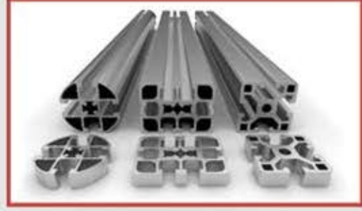
KUTU KARE PROFİLLER